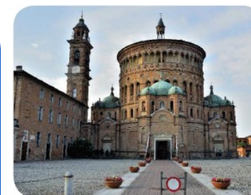
Santuario S. Maria della Croce

Antipasto "la Campagnola" Casoncelli con Salva Cremasco - Tortelli cremaschi (dolci). Cosciotto di maiale al forno con patate rosolate Dolce Vino bianco e rosso, acqua e caffè.